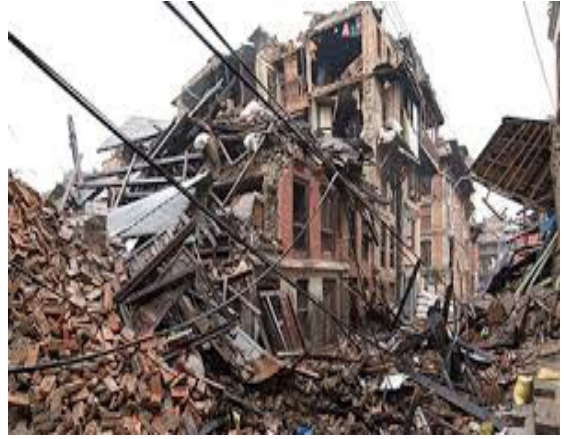
भूकम्पले गर्दा घर भत्केको

हामीले आफ्नो दैनिक जीवनमा जमिन हल्लेको, थर्केको अनुभव गरेको होला । त्यही जमिन हल्लिएको अवस्थालाई भूकम्प भनिन्छ । यसले हाम्रो भौतिक संरचना विद्यालय, मठमन्दिर, मस्जिद, भवन आदि ढलेर जान्छ, जसबाट धेरै नै क्षति हुन जान्छ । भूकम्प शब्द 'भू' र 'कम्प' मिलेर बन्छ जस्मा 'भू' को अर्थ जमिन र 'कम्प'को अर्थ कम्पन्न (काम्नु/हल्लिनु/थर्किनु) भन्ने हुन्छ । तसर्थ भूकम्पको अर्थ जमिन हल्लिनु भन्ने बुझिन्छ ।